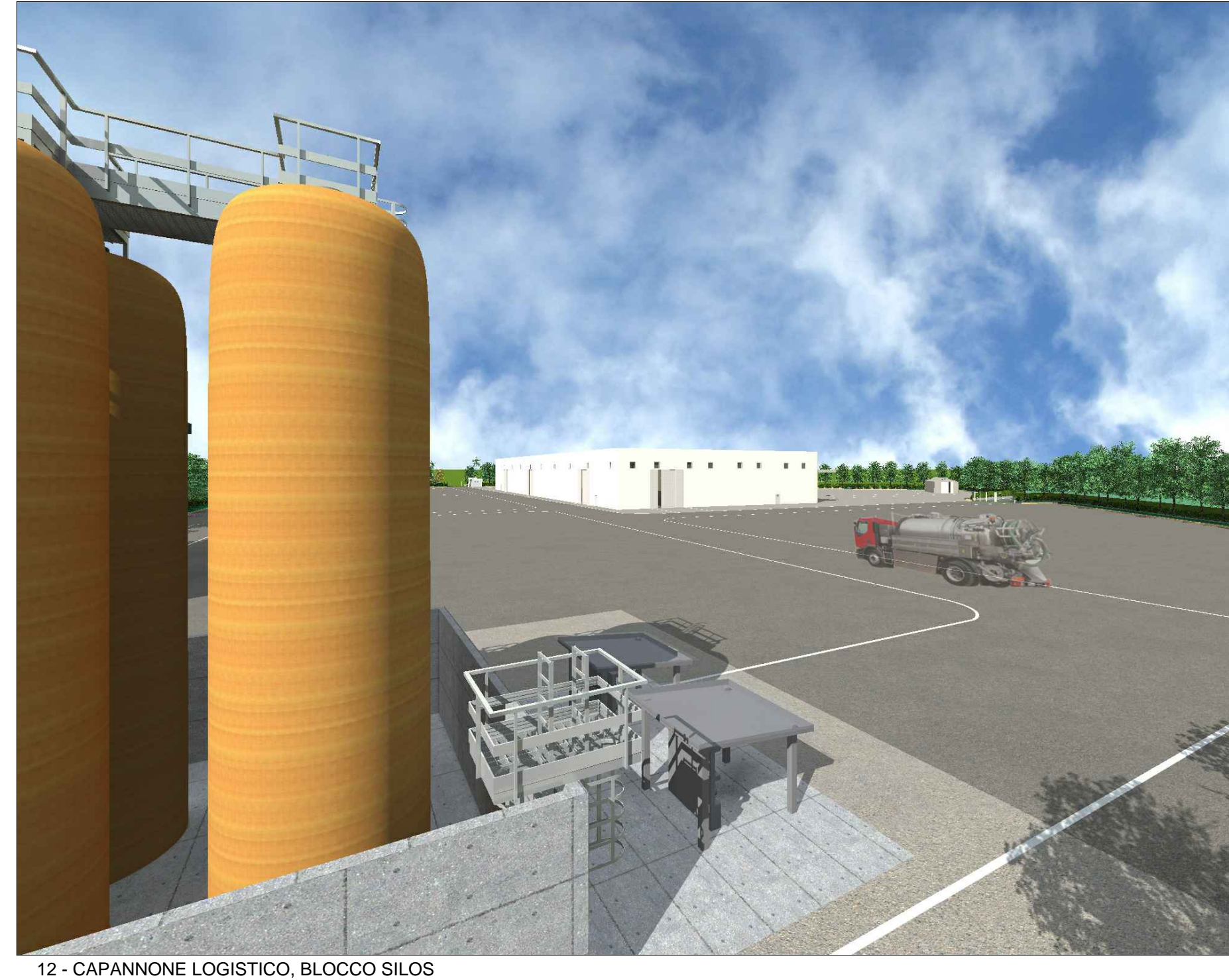
12 - CAPANNONE LOGISTICO, BLOCCO SILOS