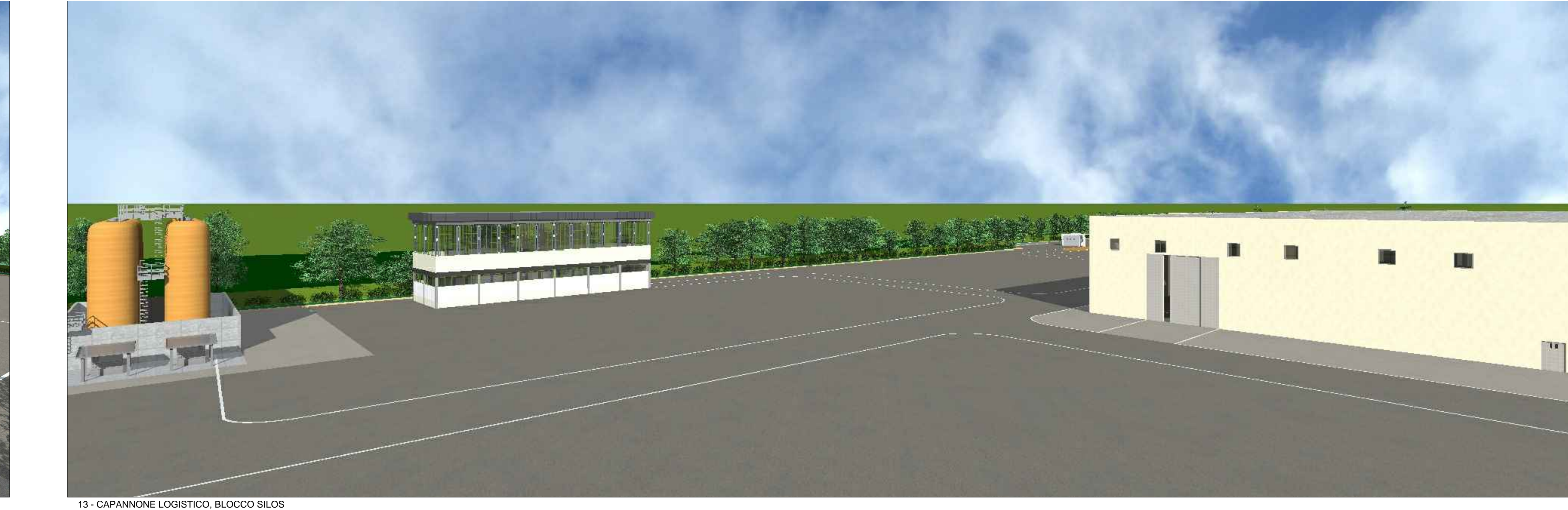
13 - CAPANNONE LOGISTICO, BLOCCO SILOS