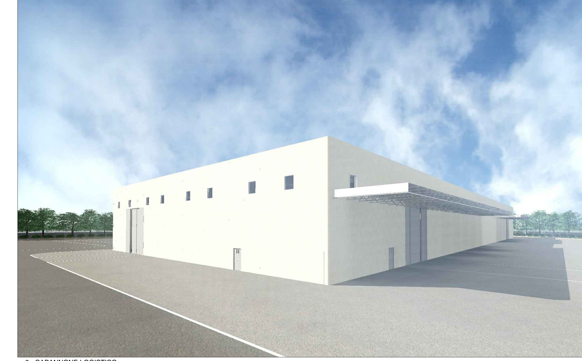
6 - CAPANNONE LOGISTICO