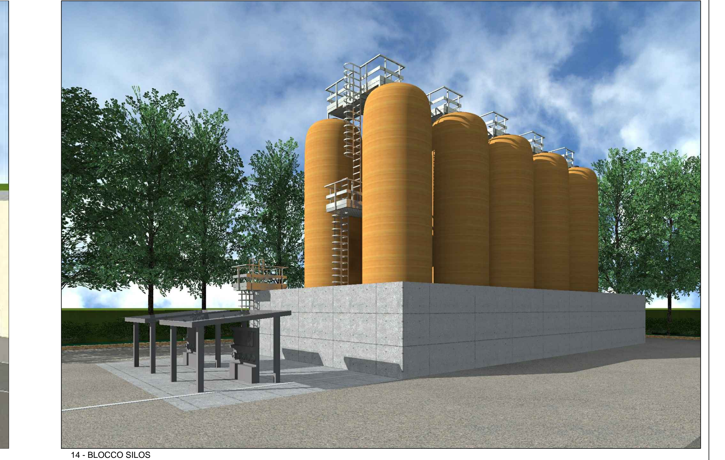
14 - BLOCCO SILOS