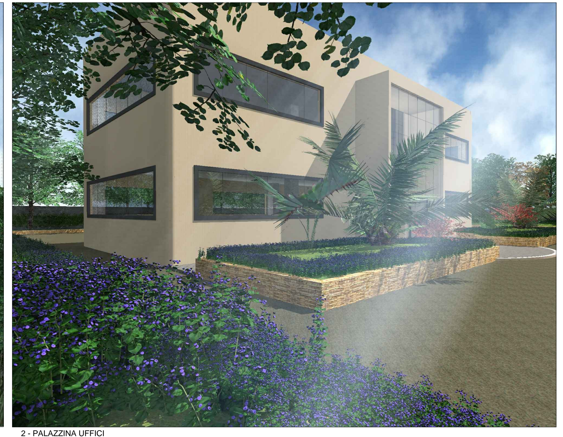
2 - PALAZZINA UFFICI