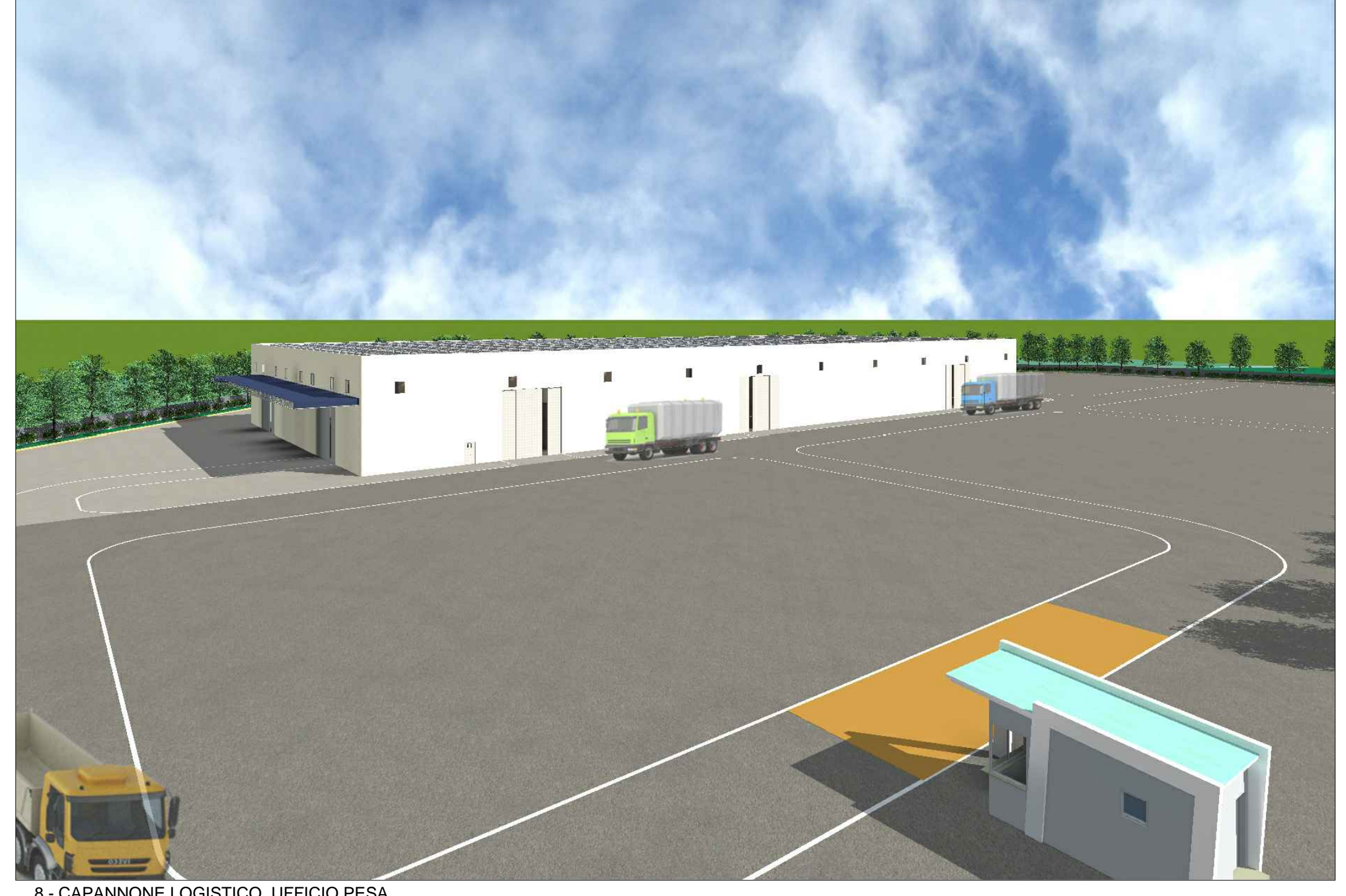
8 - CAPANNONE LOGISTICO, UFFICIO PESA