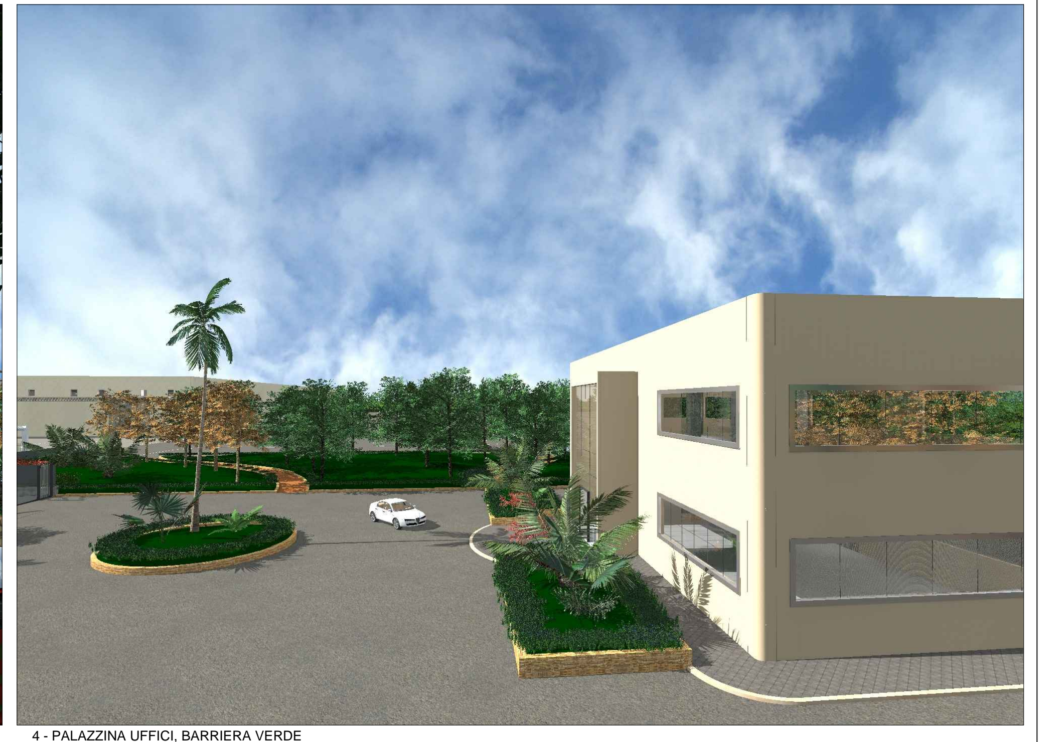
4 - PALAZZINA UFFICI, BARRIERA VERDE