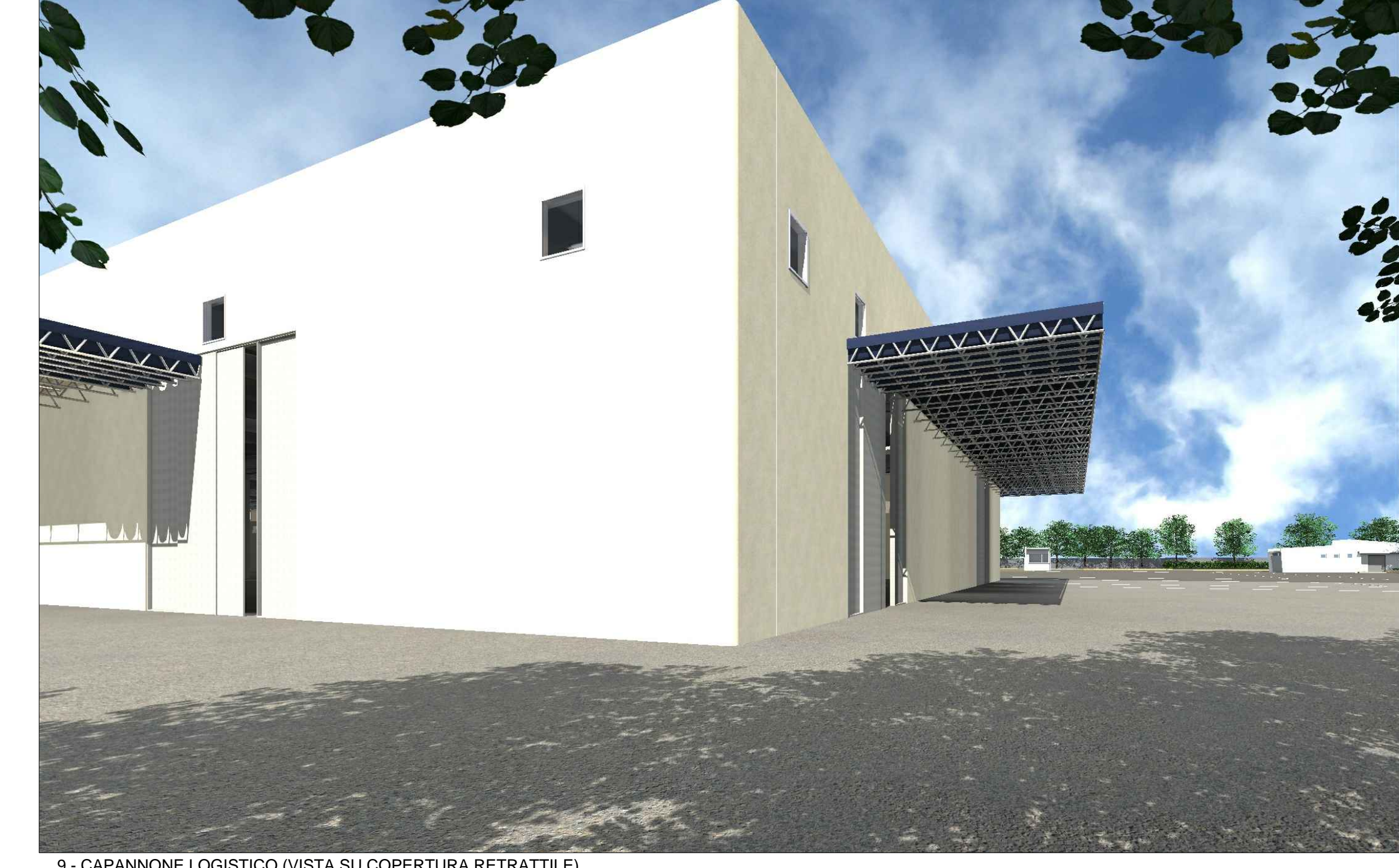
9 - CAPANNONE LOGISTICO (VISTA SU COPERTURA RETRATTILE)