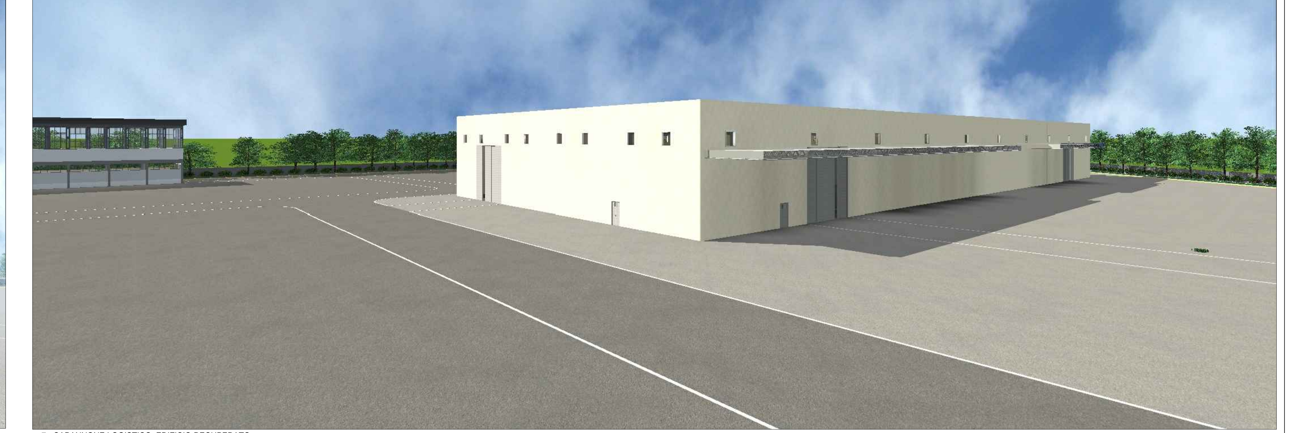
7 - CAPANNONE LOGISTICO, EDIFICIO RECUPERATO