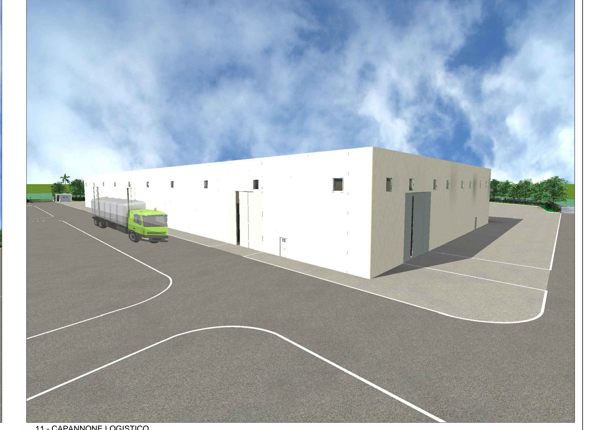
11 - CAPANNONE LOGISTICO