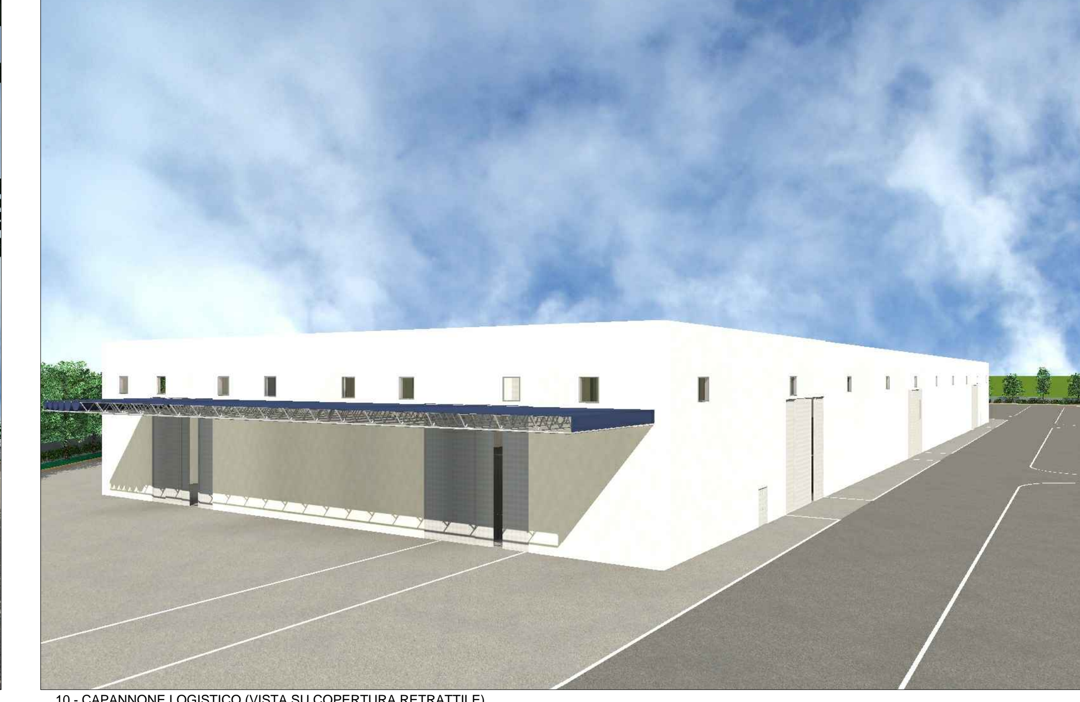
10 - CAPANNONE LOGISTICO (VISTA SU COPERTURA RETRATTILE)