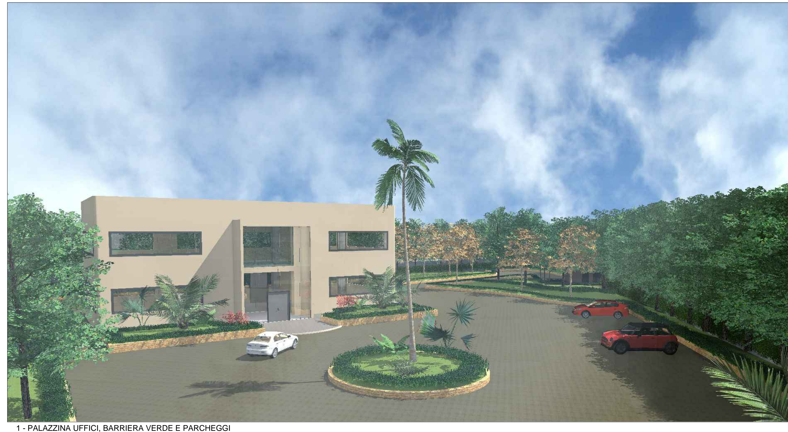
1 - PALAZZINA UFFICI, BARRIERA VERDE E PARCHEGGI