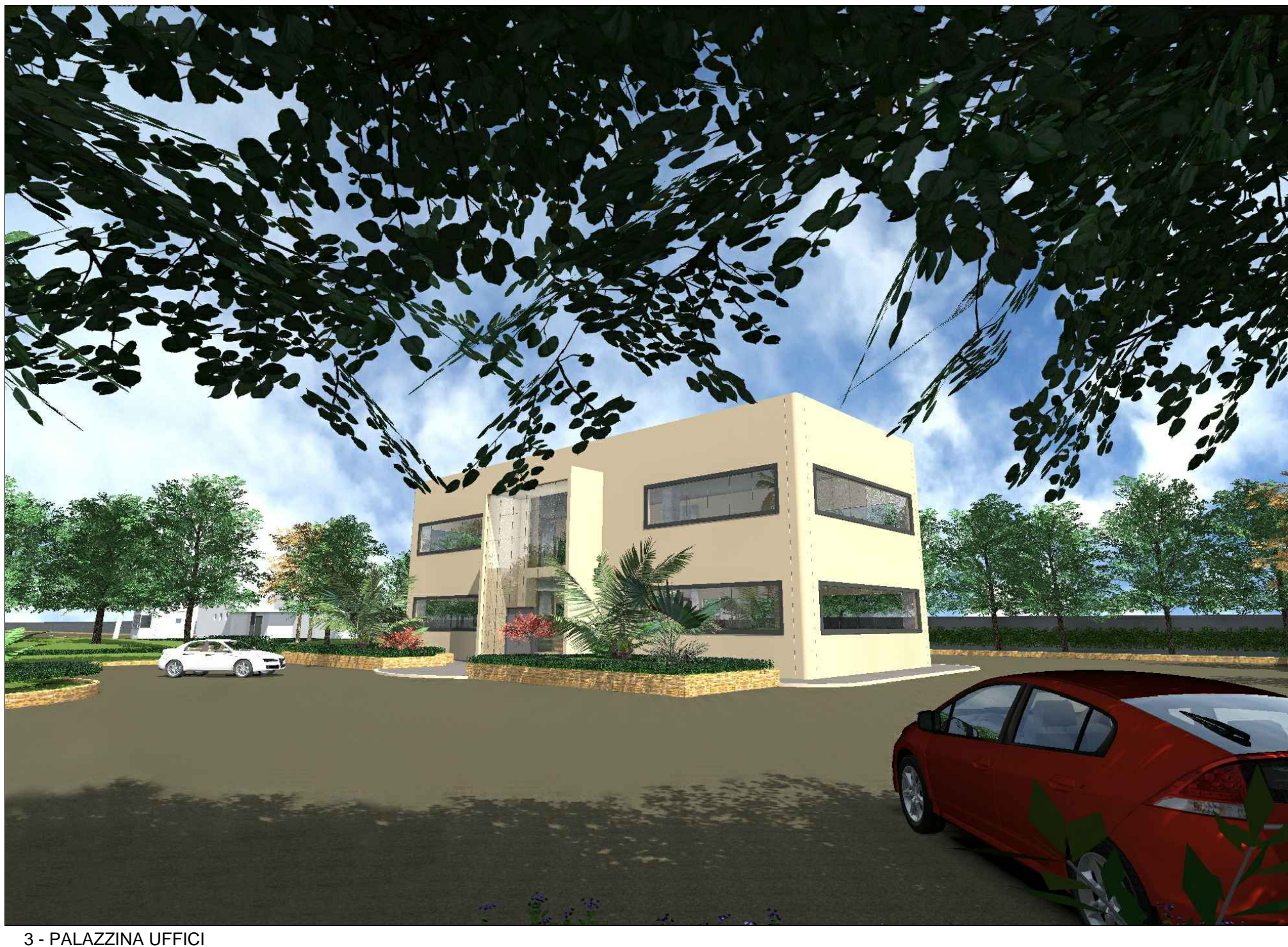
3 - PALAZZINA UFFICI