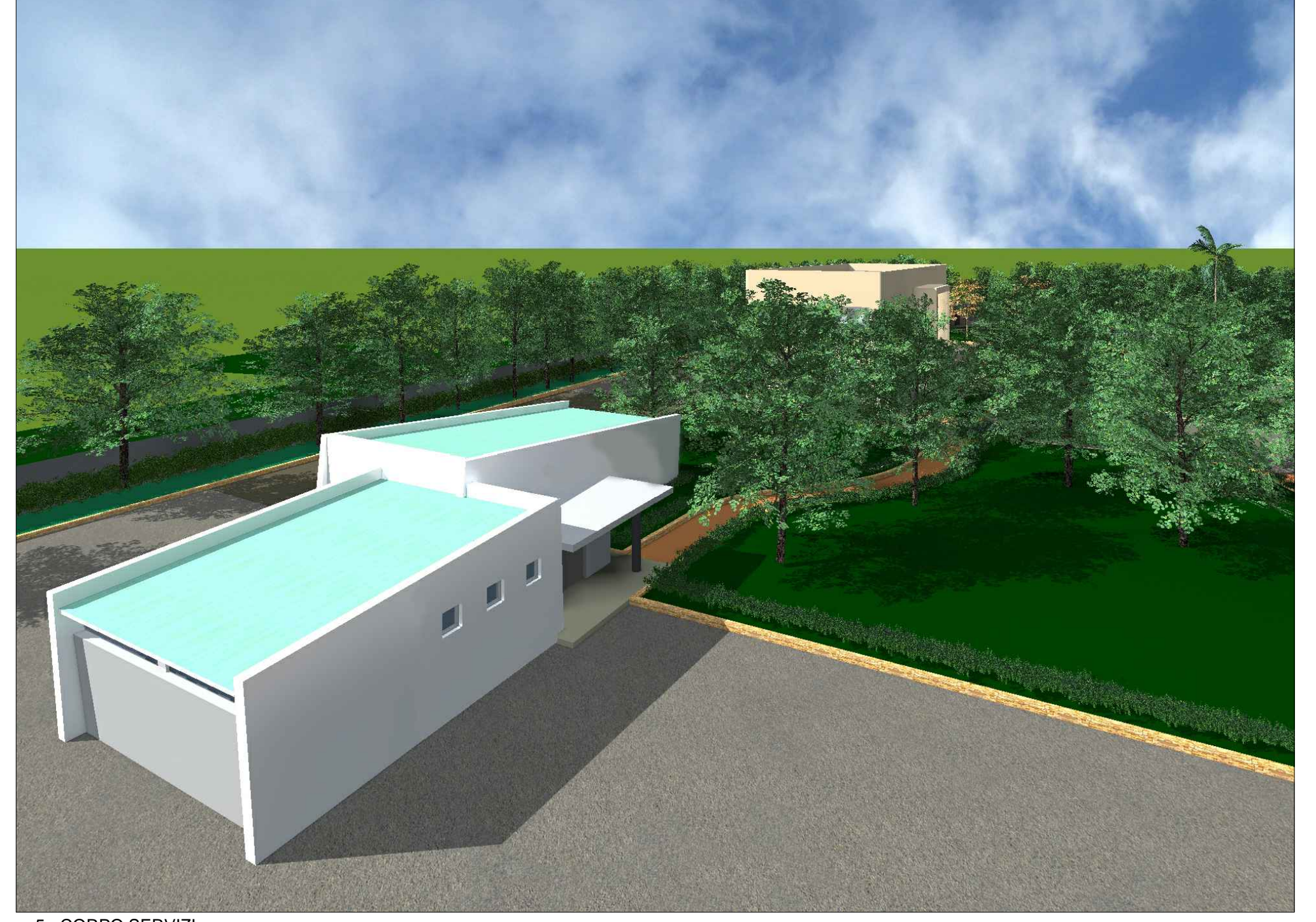
5 - CORPO SERVIZI